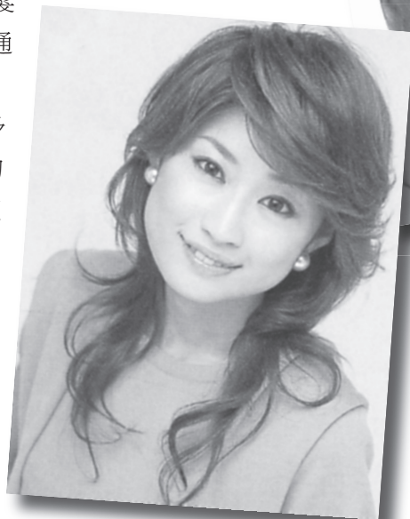
▲像是不經意，輕鬆自在的線條，正是時下流行的髮型。