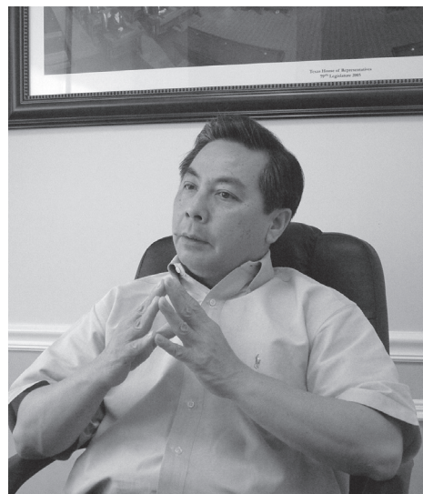
▲第一位越裔德州議員武休伯

到美國，他們省吃儉用，勤勞工作，像中國人一樣很會存錢，不敢隨便花錢，經過20年，現在他們有了觀念，在辛勤工作之外，可以享受一些生活，去些好館子，但仍然保有儲蓄觀念，比起以前較願意消費。越裔有許多中小企業，開發商、建築商、地產商、貸款公司有些做得相當出色，他們在休士頓各區作投資，專業裡牙醫特別多，此外律師和其他學有專長的行業