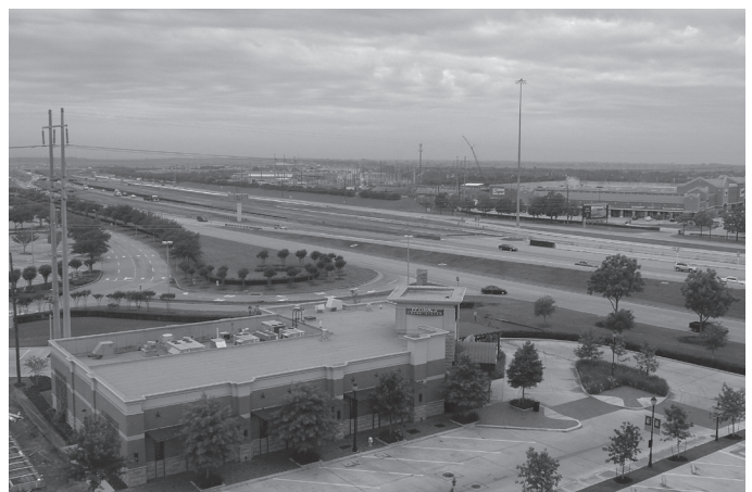
▲糖城市在五十九公路旁發展成繁榮的中產社區。

預測2005年經濟會持續成長，房屋銷售會有5%增長率，賣出6千多個房屋，稅收增加五個百分點。