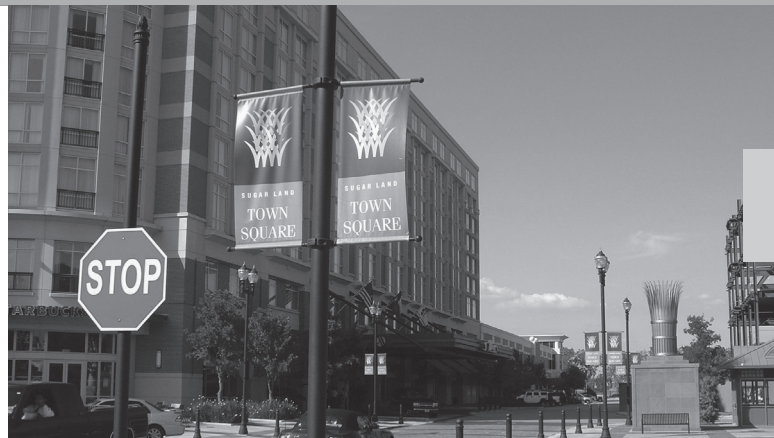
▲糖城市政廳前的商圈，全國名品連鎖店在這裡出現，展現都會風貌。

想要不增加居民稅收，又有足夠財源支持龐大建設，商業稅收因此就成為重要的來源，黃安祥說，新近完成使用的糖城市政府，附近規劃新穎的商圈，集中了多個全國知名的連