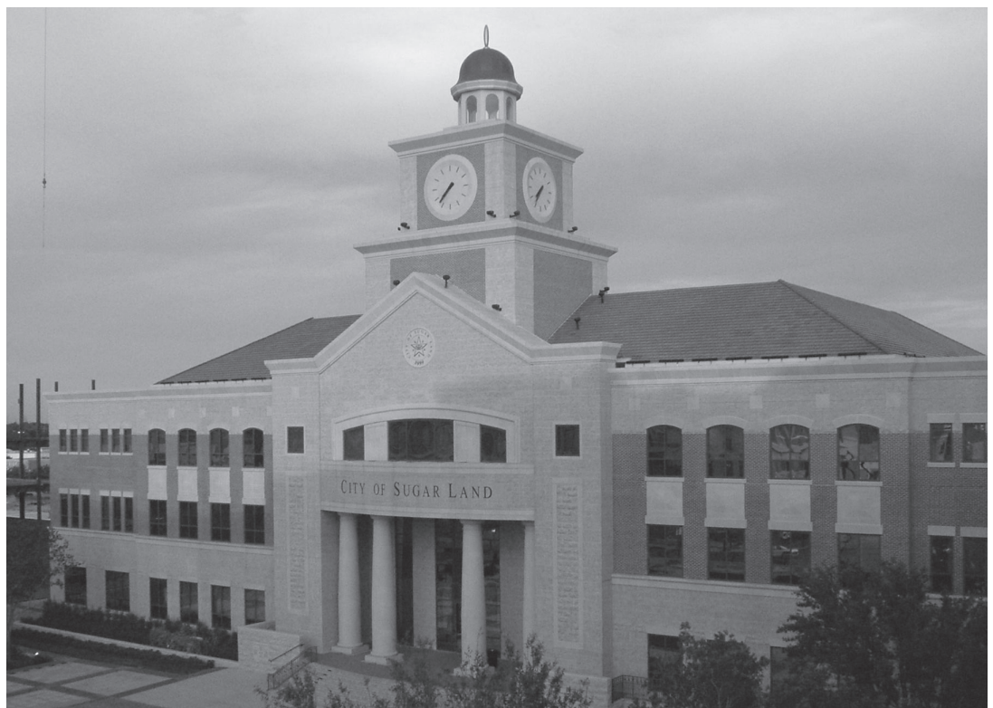
▲Sugar Land City Hall